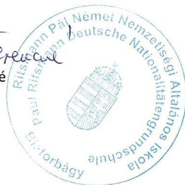
Rack Ferencné igazgató