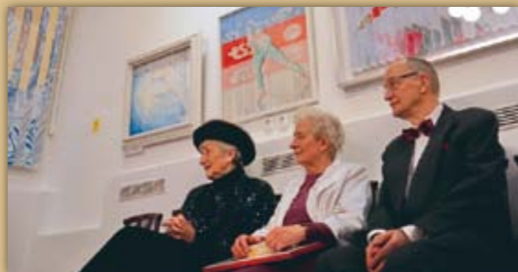
Kép: Csikós Gábor