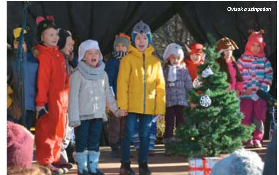
Ovisok a színpadon

Közben persze a színpadon is mozgalmos volt az élet. Biatorbágy általános iskolásai egymást követték a deszkákra; énekszóval, tánccal, különböző, az ünnephez köthető performance-okkal örvendeztették meg az egybegyűlteket, a mobiltelefonjaikkal elszántan felvétel készítő szülőket s nem utolsósorban tanárait. Jutott itt fellépés a Juhász Ferenc Művelődési Központ Népiénekműhelyének, csakúgy, mint a Biatorbágyi Népdalkörnek. A Faluház sem bizonyult üresnek. A város a hagyománynak megfelelően itt köszöntötte az elmúlt fél év során világra