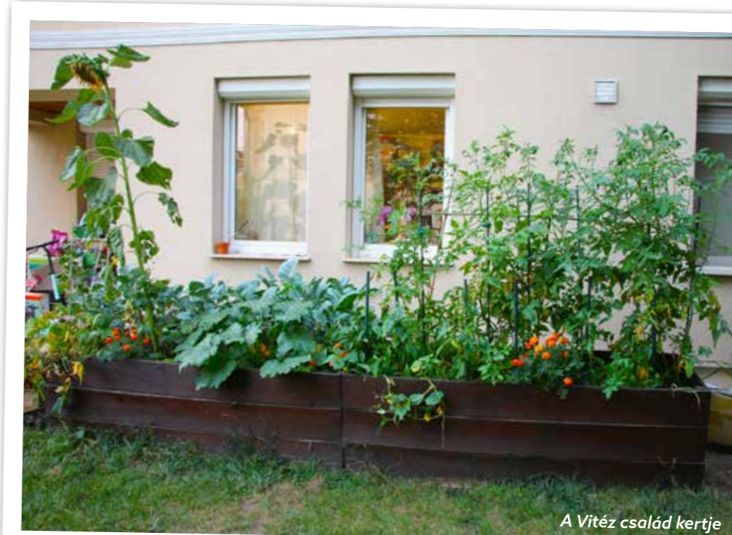
A Vitéz család kertje