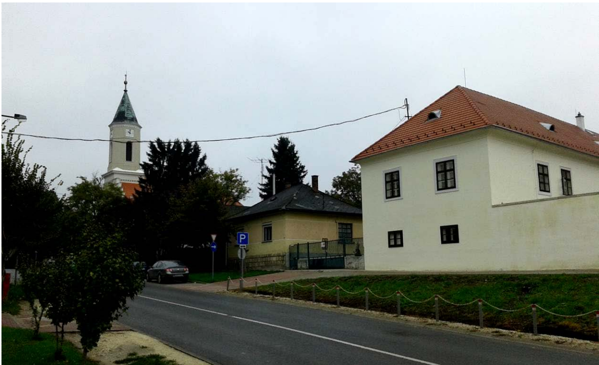
Nagy utca képe a tervezett óvoda előtt

Az ajánlatkérő elvárása, hogy olyan 4 csoportos új óvoda létesüljön, amely 2 csoporttal könnyedén bővíthető. Az ajánlatkérő határozott településképi elvárása, hogy a tervezett új épület a környezet hagyományos építészeti karakteréhez illeszkedjen, azt erősítse.