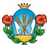
Biatorbágy címerének felülvizsgálata