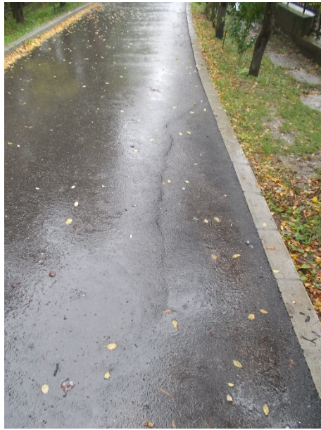
Kiskockakő burkolat mozog