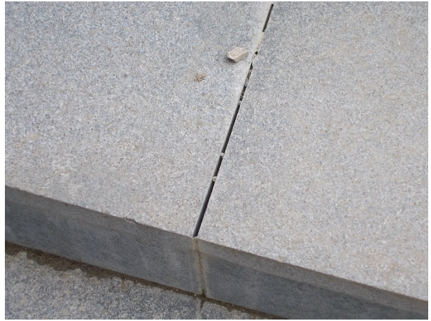
Fedkő ragasztása nem megfelelő