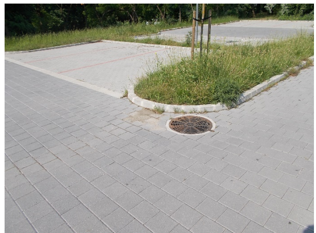
Aknafedlap beton gallérja nem megfelelő