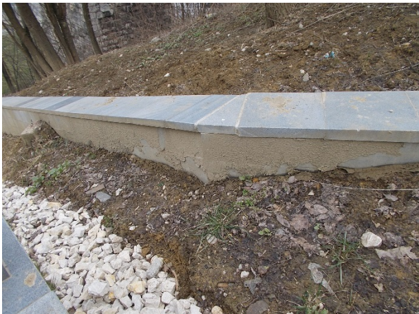
A fugázás hiányos