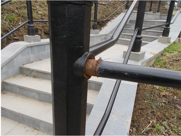
A korlát ragasztása nem megfelelő