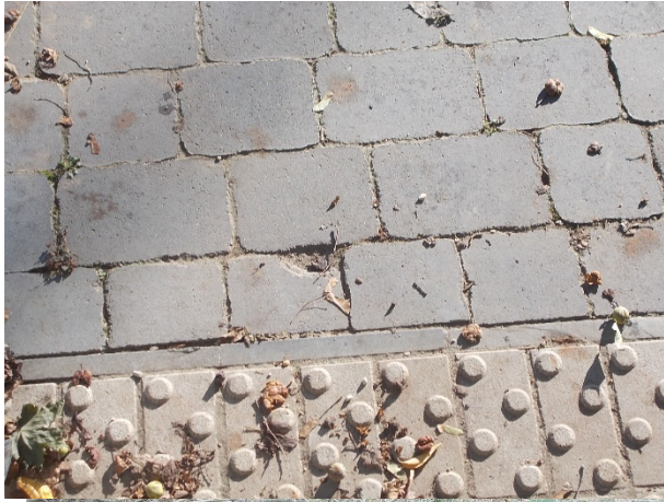
A munkaterület mellett építési törmelék maradt