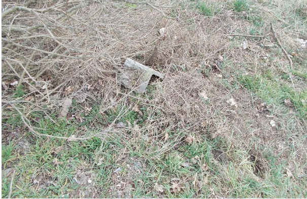
Boldog Gizella utcai parkoló