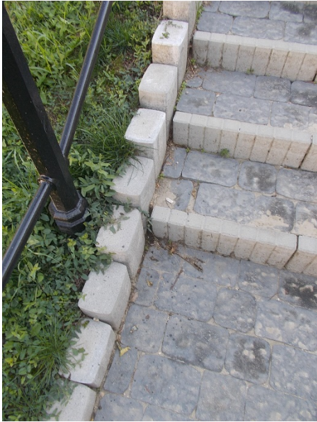
A forrásfoglaláshoz vezető út kövei kimozdultak