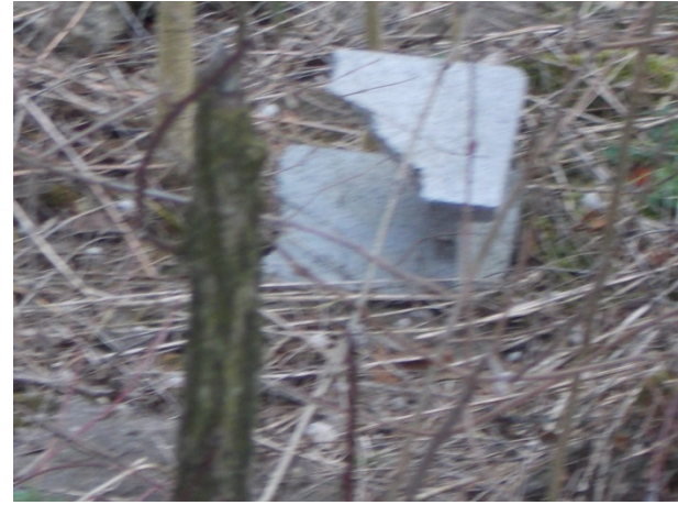
A térkő burkolat