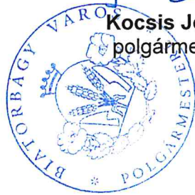
Kocsis József polgármester

A handwritten signature in blue ink, appearing to read "Dr. Cserniczky Tamás".