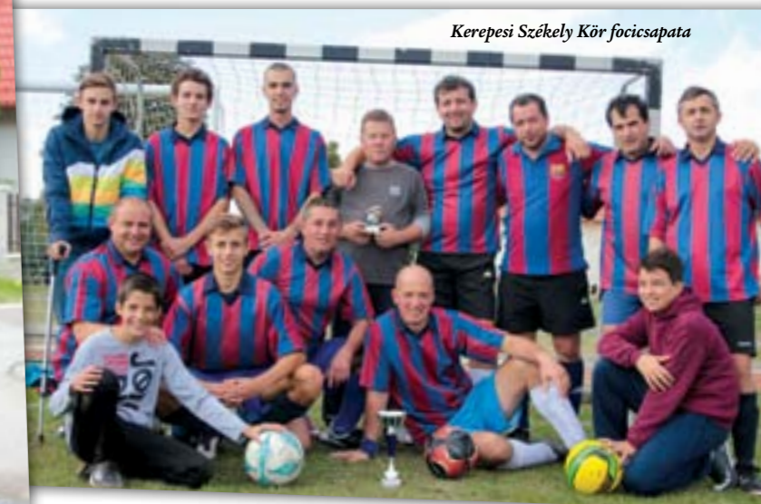
Kerepesi Székely Kör focicsapata

Az esti színpadi produkciók sorát a Kerepesi Székely Hagyományörző Kör zenés, táncos, nótás kamaraszíndarabja nyitotta