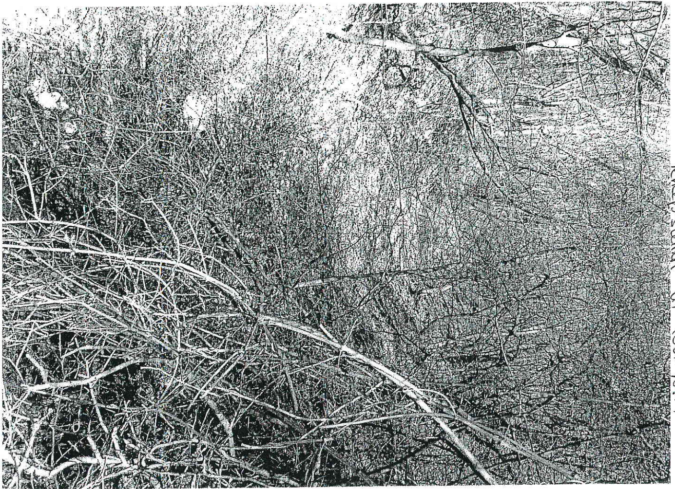
Tekepsuik' it (ost ha)