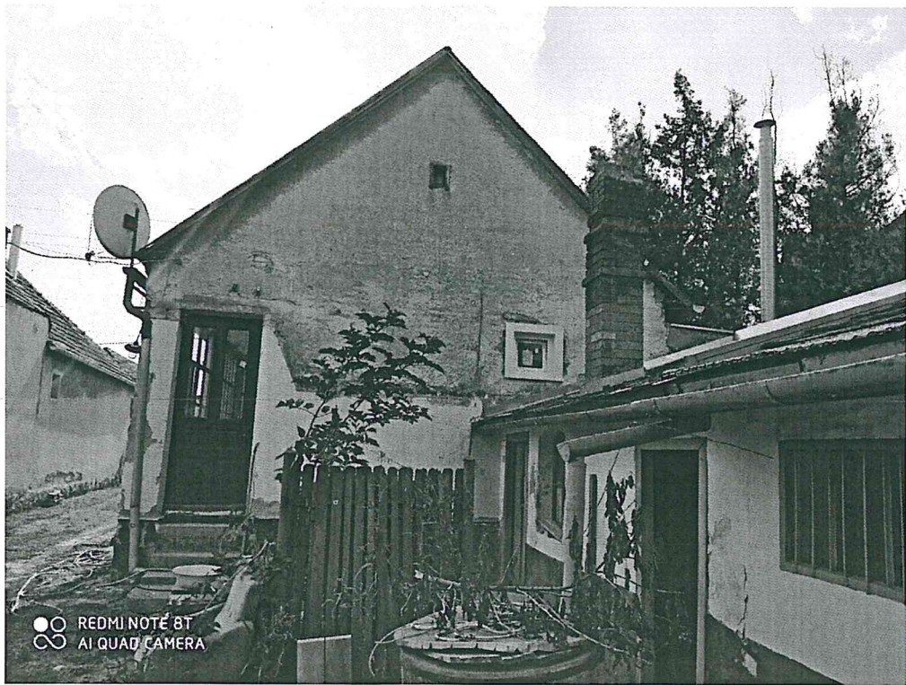
Az épület keleti véghomlokzata