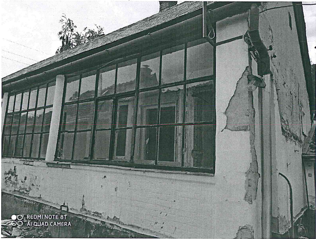
A felújítandó nyílászárók, vakolatok