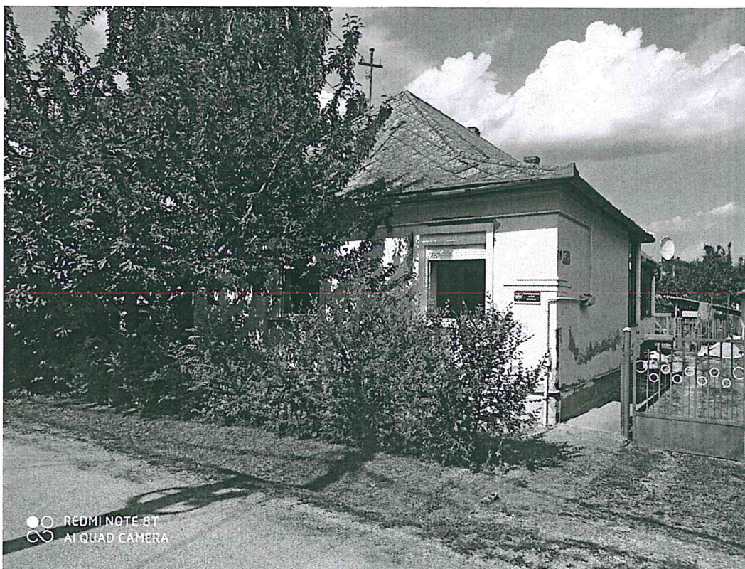
Az utcai homlokzat