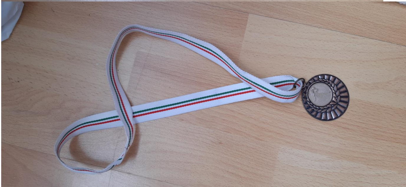
Serdülő strandkézilabda kupa 3. helyezés