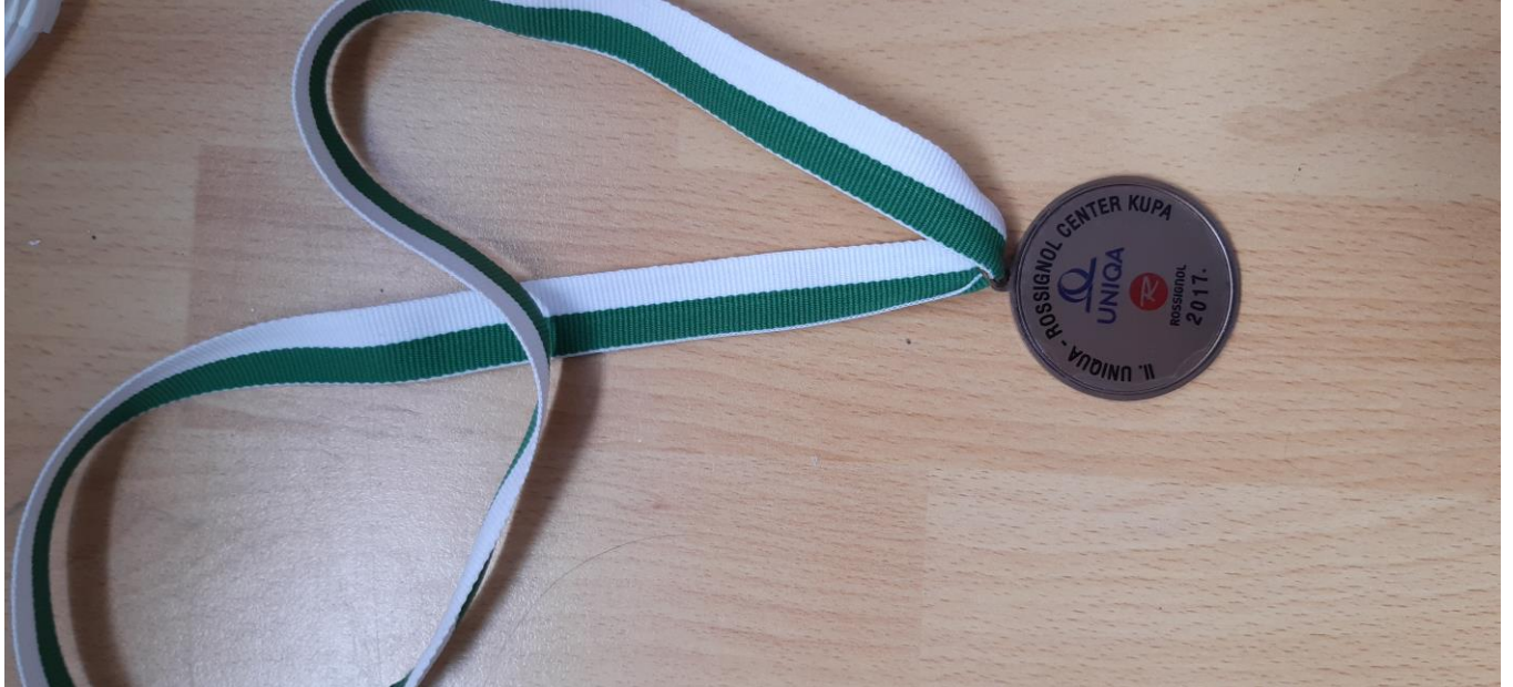
Rossignol Center kupa 3.heylezés (strandkézilabda)