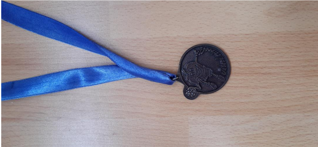
Pest megyei utánpótlás bajnokság 3. helyezés