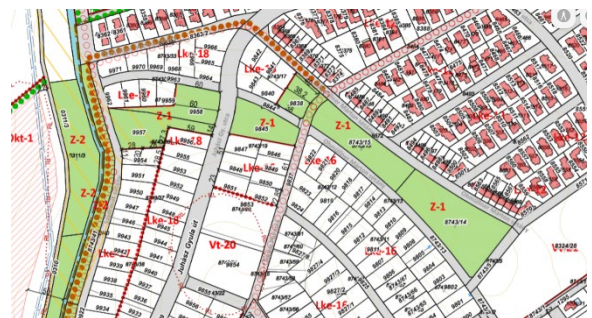
2021. évi Hész.